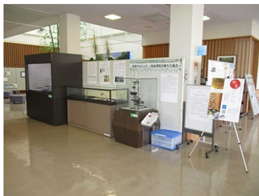
①清水町地域交流センター