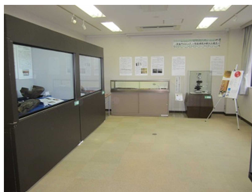
②伊東市文化財管理センター