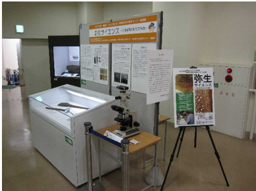
①静岡市立登呂博物館