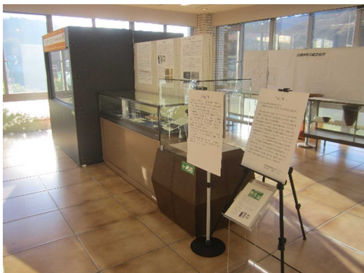
②川根本町文化会館