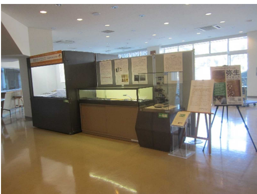
③島田市川根文化センターチャリム21