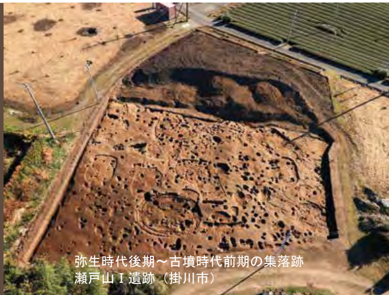
弥生時代後期～古墳時代前期の集落跡 瀬戸山Ⅰ遺跡（掛川市）