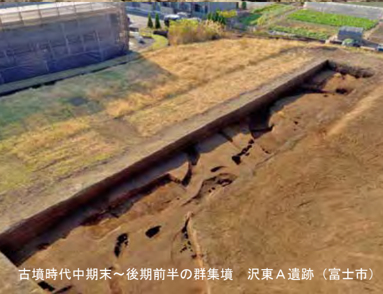
古墳時代中期末～後期前半の群集墳 沢東A遺跡（富士市）