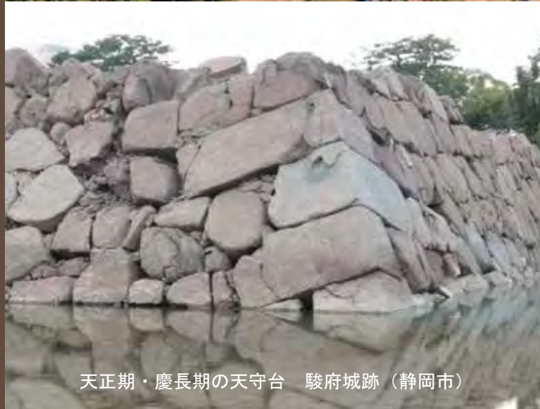
天正期・慶長期の天守台 駿府城跡（静岡市）