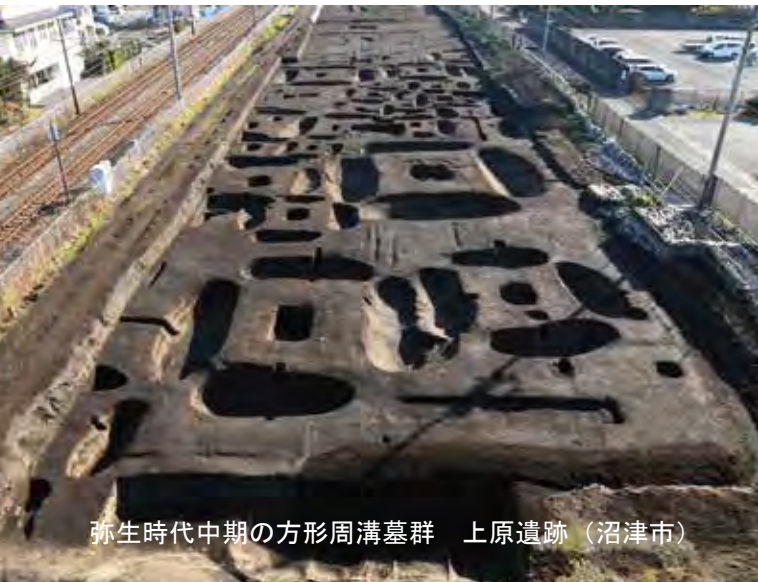
弥生時代中期の方形周溝墓群 上原遺跡（沼津市）